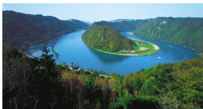
Die „Schlögener Schlinge“

Reisedienst Warias GmbH Erich-Ollenhauer-Str. 42 59192 Bergkamen Tel: 02307/88367 Fax: 02307/83404 e-mail: info@reisedienst-warias.de